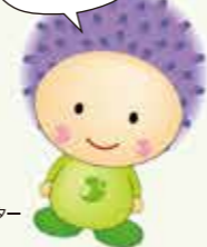
産山村 イメージキャラクター 「うぶちゃん」