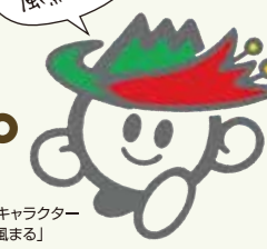
高森町キャラクター 「風まる」