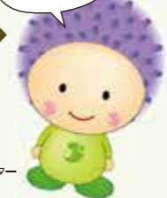
産山村 イメージキャラクター 「うぶちゃん」