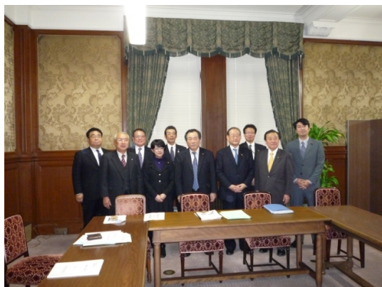
全員との記念写真

その後、今回最も被害の最も大きかった川添長島町長より被害の詳細について説明をおこなった。